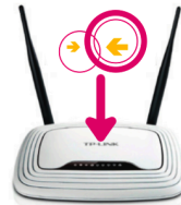
Ein neuer Freifunk-Router