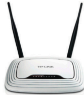
Ein kommerzieller Router